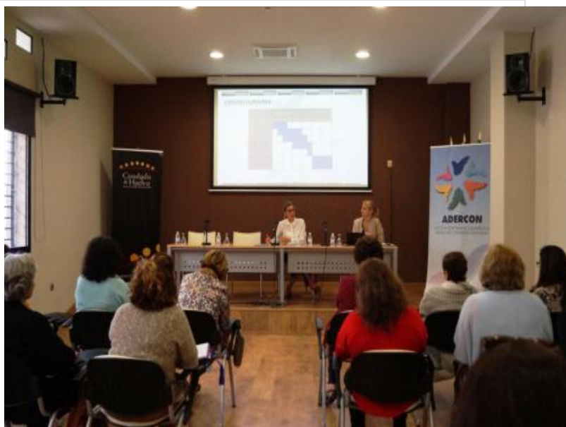
( http://www.adercon.es/export/sites/gdradercon/es/.galleries/imagenes-noticias/imagenes-noticias-2016/4-comision-genero.jpg )