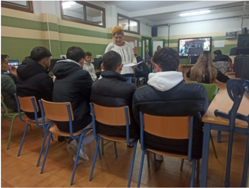
( http://www.adercon.es/es/.galleries/imagenes-noticias/20230223-4-ESO-IES-Carabelas.-Taller-de-competencias-transversales-para-el-empleo.ji )