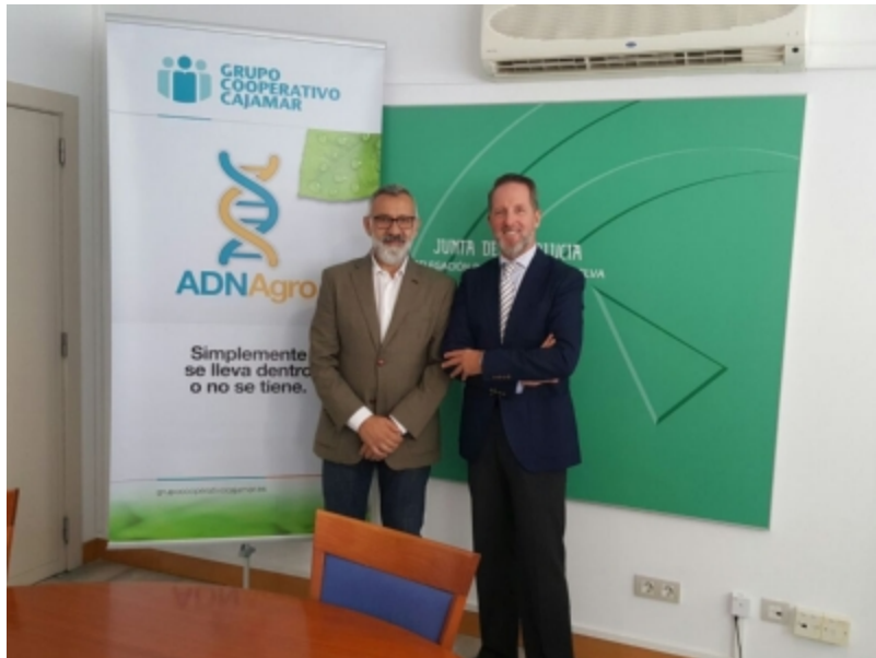
( http://www.adercon.es/es/.galleries/imagenes-noticias/imagenes-noticias-2017/20170706-Firma-convenio-con-Cajamar-5.jpeg )