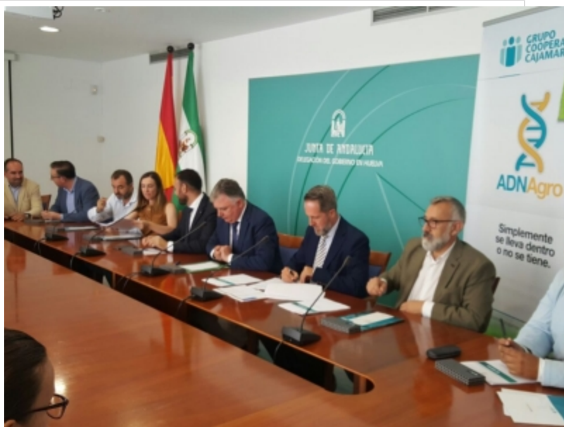
( http://www.adercon.es/es/.galleries/imagenes-noticias/imagenes-noticias-2017/20170706-Firma-convenio-con-Cajamar-4.jpeg )