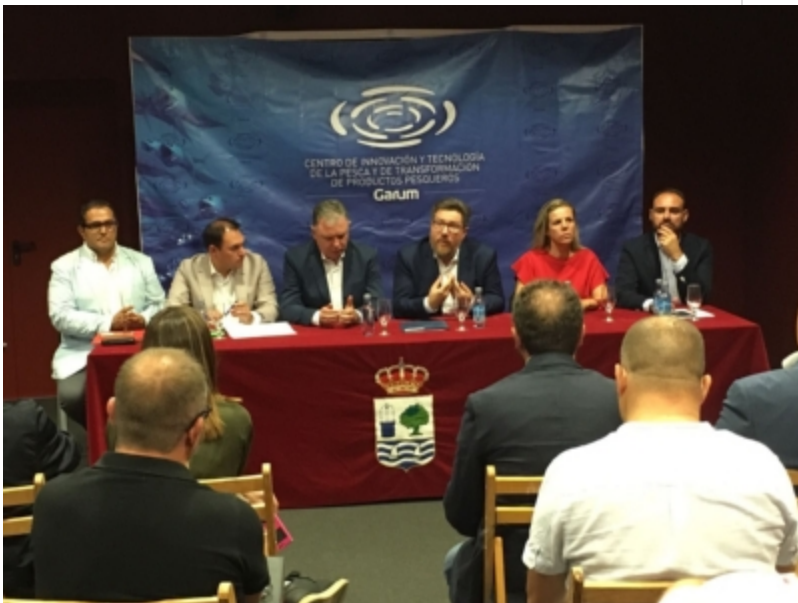
( http://www.adercon.es/es/.galleries/imagenes-noticias/imagenes-noticias-2017/20170913-Reunion-GDR-onubenses-1.jpeg )