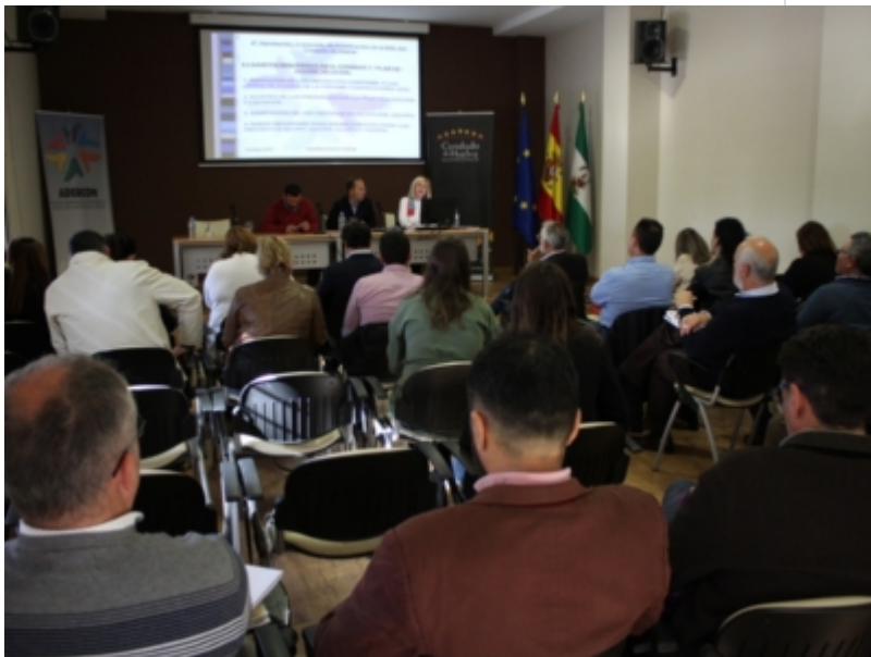
( http://www.adercon.es/es/.galleries/imagenes-noticias/Este-martes-se-celebro-la-Asamblea-y-se-reunio-la-Junta-Directiva-de-ADERCON.jp )