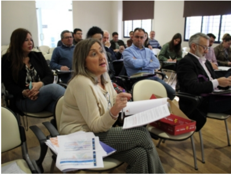
( http://www.adercon.es/es/.galleries/imagenes-noticias/La-Asamblea-aprobo-el-presupuesto-de-2020-y-algunas-modificaciones-de-la-EDL.jp )