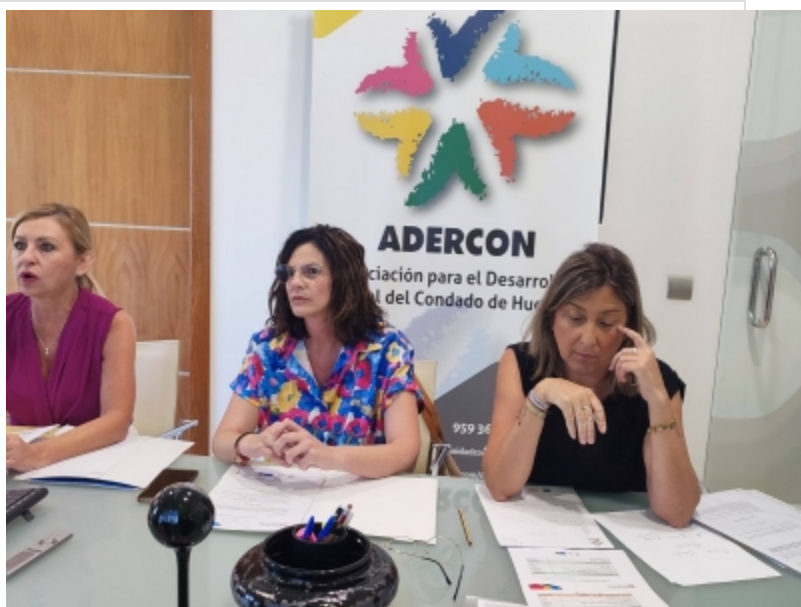
( http://www.adercon.es/es/.galleries/imagenes-noticias/imagenes-noticias-2022/Durante-todo-el-marco-estrategico-se-han-aprobado-ayudas-por- )

El otro proyecto de cooperación se ejecutará junto con dos GDR de Córdoba de las comarcas del Guadajoz Campiña Este y Medio Guadalquivir, territorios similares al Condado de Huelva con los que se realizarán actividades de promoción y encuentros de intercambio de experiencias.