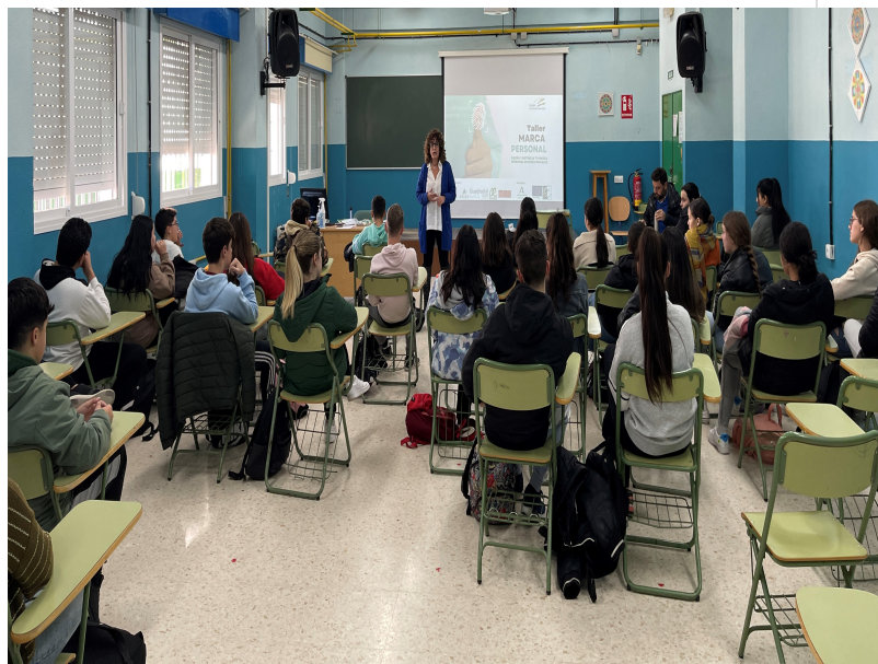
( http://www.adercon.es/export/sites/gdradercon/es/.galleries/imagenes-noticias/Taller-de-marca-personal-en-el-IES-Campo-de-Tejada-de-Paterni )

El proyecto Juventud Activa cuenta con financiación pública de la Unión Europea mediante el Fondo Europeo Agrícola de Desarrollo Rural (FEADER) en un 90% y por la Consejería de Agricultura, Pesca, Agua y Desarrollo Rural de la Junta de Andalucía en un 10%.