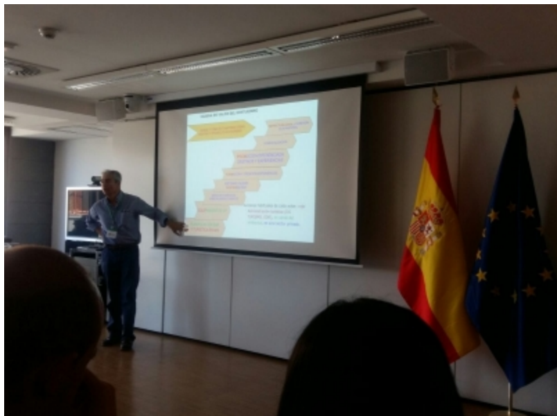
( http://www.adercon.es/es/.galleries/imagenes-noticias/imagenes-noticias-2017/20170727-Declaracion-Daimiel-Ecoturismo-2.jpeg )