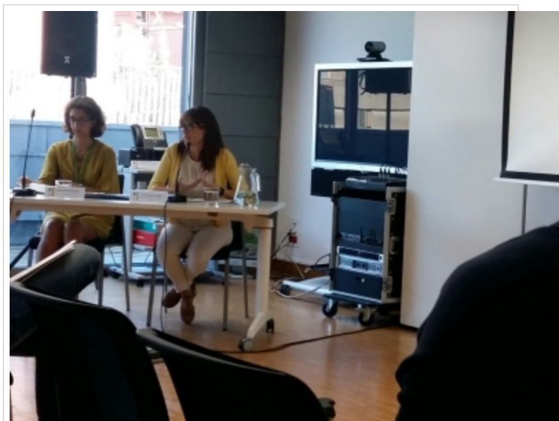
( http://www.adercon.es/es/.galleries/imagenes-noticias/imagenes-noticias-2017/20170727-Declaracion-Daimiel-Ecoturismo-1.jpeg )