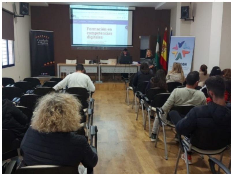
( http://www.adercon.es/es/.galleries/imagenes-noticias/Curso-de-Competencias-Digitales-de-ADERCON-2.jpeg )

Estas formaciones se han financiado por la Unión Europea mediante el Fondo Europeo Agrícola de Desarrollo Rural (FEADER) en un 90% y por la Consejería de Agricultura, Pesca, Agua y Desarrollo Rural de la Junta de Andalucía en un 10%.