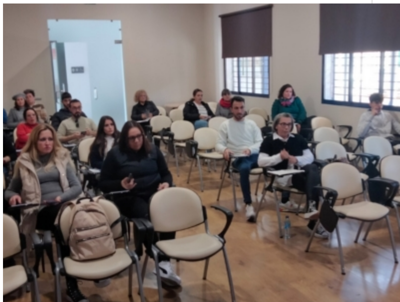
( http://www.adercon.es/es/.galleries/imagenes-noticias/Curso-de-Competencias-Digitales-de-ADERCON-3.jpeg )